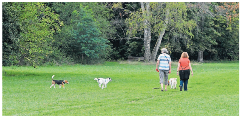
Viele Hundebesitzer in Nürnberg nutzen die Möglichkeit, ihre Vierbeiner auf den Hundefreilaufflächen, so wie hier im Volkspark Marienberg, auch einmal ohne Leine laufen zu lassen.