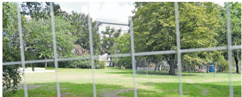
Der Cramer-Klett-Park am Laufertorgraben wird derzeit generalsaniert und kann deshalb nicht genutzt werden, das betrifft auch die Freilauffläche. Sie werde im Herbst wieder geöffnet, teilt der Servicebetrieb Öffentlicher Raum (Sör) mit.