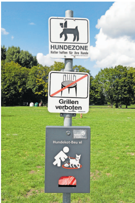
Auf dieser Fläche dürfen Hunde ohne Leine laufen. Nur wo ein solches Schild zu sehen ist, ist das in Nürnberg erlaubt.